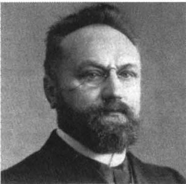
Dr. H. Bavinck (1854-1921)

Van het tegendeel, het kunstmatig conserveren van het lichaam, voortkomend uit bijgeloof (boeddhisme) of uit een verlangen om op deze door de zonde vervloekte aarde eeuwig te kunnen blijven leven, is een Christen evenzeer wars. Zo zijn er heden ten dage enkelen, zogenaamde cryonisten, die zich direct na hun overlijden geheel of gedeeltelijk onder stikstof bij -196^{\circ}\text{C} willen laten invriezen, in de verwachting dat over enkele tientallen jaren de wetenschap zover is voortgeschreden dat zij door de mensen die dan leven, weer tot leven gewekt kunnen worden 4 . En zo blijft de mens in verwaande hoogmoed maar zoeken naar wegen om God te evenaren en het door Hem uitgesproken oordeel: tot stof zult gij wederkeren , opgeheven te krijgen. Nee, een “Christen conserveert de lijken niet kunstmatig, gelijk de Egyptenaren” vroeger uit superstitie of bijgeloof deden 5 , “hij vernielt ze ook niet mechanisch” door ze te cremeren, “zooals thans velen begeeren, maar hij vertrouwt ze aan den schoot der aarde toe, en laat ze rusten tot den opstandingsdag”, aldus dr. H. Bavinck in zijn Gereformeerde Dogmatiek 6 .