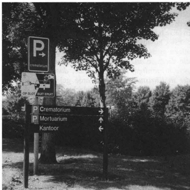
Ook wij kunnen uitgenodigd worden tot het bijwonen van een crematieplechtigheid in een crematorium. Daarom is het van belang om te weten waarom we deze vorm van lijkbezorging afwijzen en op zulk een uitnodiging niet in mogen gaan.

Het Nieuwe Testament wijkt op het punt van lijkbezorging niet af van het Oude Testament. De discipelen van Johannes de Doper legden hem na zijn onthoofding in een graf (Mark. 6:29). Ananías en zijn vrouw Saffira werden van het aangezicht der apostelen weggedragen om begraven te worden (Hand. 5:6,10). Nadat Stéfanus gestenigd was, droegen enige Godvruchtige mannen hem ten grave (Hand. 8:2). Lázarus werd door Jezus