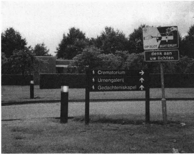
Een raadslid kan en mag in het licht van Gods Woord niet anders dan tegen voorstellen stemmen die het realiseren en instandhouden van een crematorium, een urnengalerij, een urnentuin of iets dergelijks beogen.

Christus onzen Heere (Rom. 6:23). Die genadegift Gods in Christus overstijgt dood en graf. Dat mocht Job door het geloof weten; daarvan mocht hij getuigen, zeggende: ik weet: mijn Verlosser leeft, en Hij zal de laatste over het stof opstaan; en als zij na mijn huid dit doorknaagd zullen hebben, zal ik uit mijn vlees God aanschouwen; Denwelken ik voor mij aanschouwen zal, en mijn ogen zien zullen, en niet een vreemde; mijn nieren verlangen zeer in mijn schoot (Job 19:25-27). Job mocht hier over dood en graf heen zien. En wij? Christus heeft door het graf heen de weg naar de heerlijkheid voor al de Zijnen gebaad. Christus' begrafenis en opstanding mag dan ook, evenals bij Job, bij tijden en ogenblikken tot moedgeving en versterking van Gods volk zijn. Want zo zeker als op Zijn begrafenis Zijn opstanding gevolgd is, zo zeker zal ook op hun begrafenis hun lichamelijke opstanding tot heerlijkheid volgen. Kennen ook wij iets van dat uitzien?