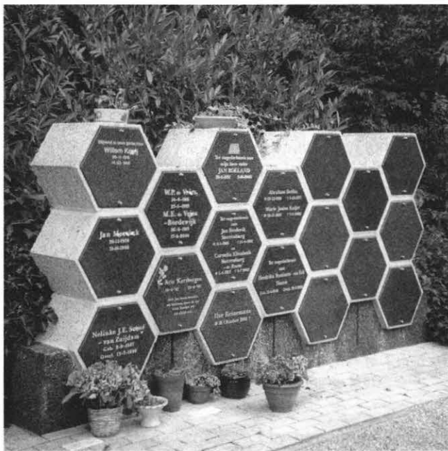
Een foto van een moderne urnenmuur op een algemene begraafplaats (de urnen zijn niet zichtbaar). Ieder gemeentebestuur dient dergelijke onbijbelse voorzieningen te weren!

We zagen dat crematie lijnrecht ingaat tegen de regel van Gods Woord. Krachtens haar roeping om God te dienen en Zijn eer en wil te bevorderen, is de overheid dan ook gehouden om crematies en alles wat daar mee samenhangt uit het openbare leven te weren. Terecht stelde daarom het oude beginselprogramma van de SGP: "De Overheid zal ook in haar ambt naar Gods wet geoordeeld worden en heeft dus voor naleving van deze wet zorg te dragen. Daarom is zij geroepen: (...) lijkverbranding te beletten" 13) . Ook het nieuwe beginselprogramma van de SGP laat ons weten dat lijkverbranding verboden dient te zijn 14) en in het SGP-gemeenteprogram is de stelling opgenomen: "Het [gemeentebestuur] weert crematoria en gelegenheden tot het bewaren of verstrooien van de as van overledenen" (artikel 10.3).