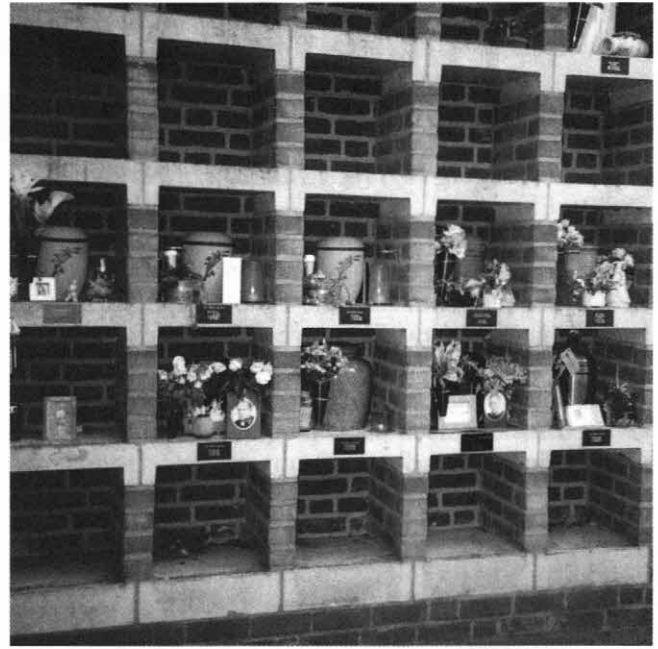
Een urnengalerij van een crematorium. Zij die door bijgelovigheid of godloochenarij de ware Godsdienst verlaten hadden, hebben in ons land de crematie en verscheidene daaraan verbonden vormen van bewaring of verstrooiing van de as weer ingevoerd.

Samenvattend kunnen we dus stellen dat begraven een voluit Christelijk en lijkverbranding een voluit heidens gebruik is. Zij die in Europa het langst heidenen zijn gebleven, hebben er ook het langst aan vastgehouden en zij die door bijgelovigheid en godloochenarij de ware Godsdienst weer verlieten en tot het heidendom terugkeerden, hebben het weer ingevoerd. Zullen wij