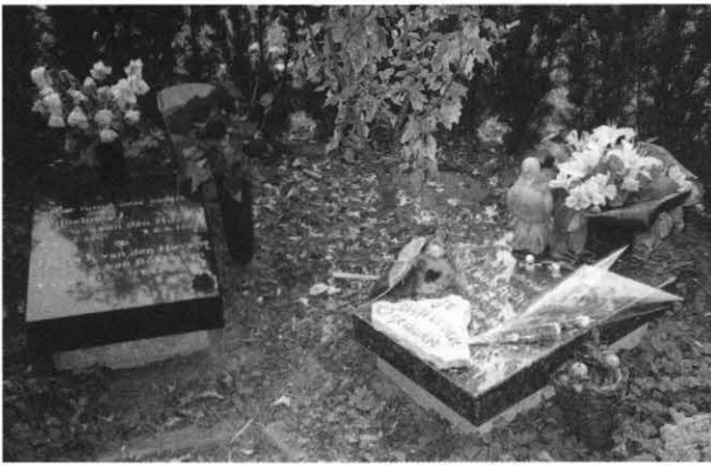
Een urnentuin op een begraafplaats. Direct onder iedere afdeksteen bevindt zich een afgesloten ruimte waarin een of twee bussen met as geplaatst zijn, afkomstig van het crematorium. Een Christen wenst zulk een lijkbezorging niet, maar hij begeert zijn lichaam ook na zijn sterven aan God over te geven.

Van het tegendeel, het kunstmatig conserveren van het lichaam, voortkomend uit bijgeloof (boeddhisme) of uit een verlangen om op deze door de zonde vervloekte aarde eeuwig te kunnen blijven leven, is een Christen evenzeer wars. Zo zijn er heden ten dage enkelen, zogenaamde cryonisten, die zich direct na hun overlijden geheel of gedeeltelijk onder stikstof bij -196^{\circ}\text{C} willen laten invriezen, in de verwachting dat over enkele tientallen jaren de wetenschap zover is voortgeschreden dat zij door de mensen die dan leven, weer tot leven gewekt kunnen worden 4 . En zo blijft de mens in verwaande hoogmoed maar zoeken naar wegen om God te evenaren en het door Hem uitgesproken oordeel: tot stof zult gij wederkeren , opgeheven te krijgen. Nee, een “Christen conserveert de lijken niet kunstmatig, gelijk de Egyptenaren” vroeger uit superstitie of bijgeloof deden 5 , “hij vernielt ze ook niet mechanisch” door ze te cremeren, “zooals thans velen begeeren, maar hij vertrouwt ze aan den schoot der aarde toe, en laat ze rusten tot den opstandingsdag”, aldus dr. H. Bavinck in zijn Gereformeerde Dogmatiek 6 .