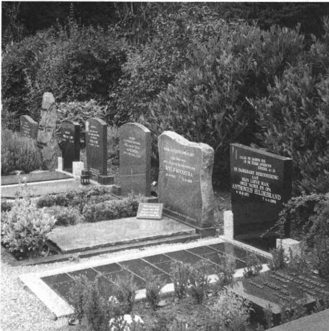
Een willekeurig genomen foto van een rij graven op een algemene begraafplaats. In Gods Woord is geenszins crematie, maar begraven de normale, algemeen gebruikelijke vorm van lijkbezorging.

Tezamen genomen komen de woorden 'graf', 'begraven', 'begraafing' en 'begravenis' in Gods Woord wel zo'n tweehonderd maal voor! Feitelijk spreekt dus geheel Gods Woord over begraven als lijkbezorging, ja, begraven was onder hen die leefden onder de uiterlijke bediening van Gods Woord feitelijk zo vanzelfsprekend en zo algemeen dat een concreet verbod op lijkverbranding niet nodig was.