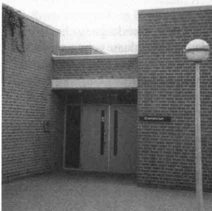
Dit kille gebouw vormt één van de 57 crematoria of verbrandingsfabrieken die Nederland 'arm' is. Crematie als normale vorm van lijkbezorging vindt geen enkele grond van goedkeuring in Gods Woord. Integendeel zelfs, het wekt Gods toorn op!

achtergrond kan ook Amos 6:10 dus moeilijk nog als bewijs dienen voor de stelling dat crematie thans zelfs in een normale situatie geoorloofd zou zijn.