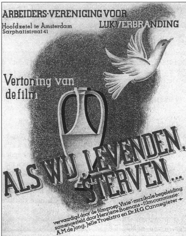
Een aankondiging van de AVVL-film 'Als wij, levenden, sterven' (1935). Door middel van deze film trachtte de AVVL onder ons volk de toen nog lage populariteit van de crematie te verhogen.

ondernomen om het cremeren ingang te doen vinden onder ons volk. Er werd uitdrukkelijk propaganda voor het cremeren gemaakt. Dit resulteerde er uiteindelijk in dat in 1955 cremeren een wettelijke vorm van lijkbezorging werd.