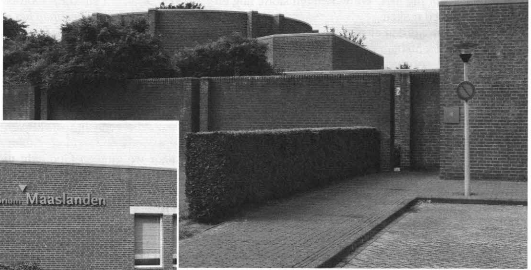
Een crematorium. Ook het meewerken of meehelpen aan de bouw van een crematorium, hetzij als raadslid of wethouder, hetzij als timmerman, metselaar of loodgieter, mogen we in het licht van de Schrift niet doen.

niet in overeenstemming brengen. Laat ons toch duidelijk afstand houden van deze heidense, antichristelijke vorm van lijkbezorging!