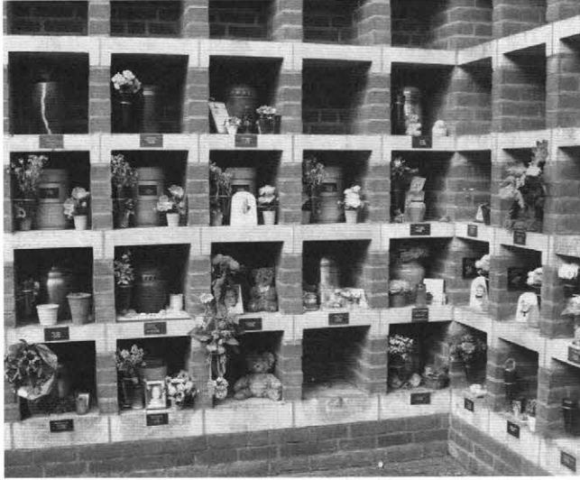
Een urnengalerij bij een crematorium. Ook de moderne kerkmens heeft geen bezwaren meer tegen cremeren; hij ziet er gewoonweg geen zonde meer in.

vrij licht over cremeren is gaan denken. De moderne kerkmens ziet er gewoon geen zonde meer in om door middel van crematie het proces van vertering, het tot stof wederkeren , in eigen hand te nemen.