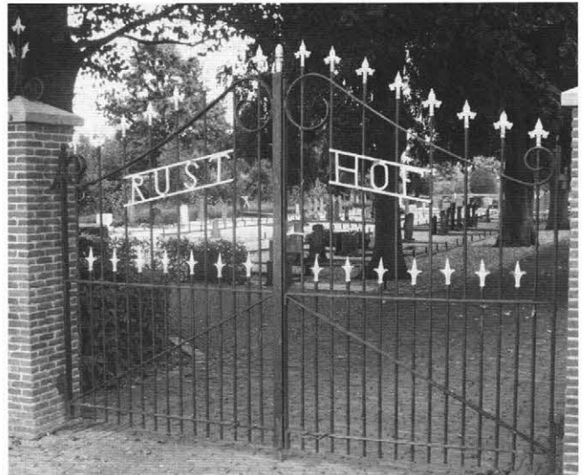
Een rusthof? Voor Gods volk geldt dat hun lichamen waarlijk mogen rusten in hun graf. 'Zij zullen rusten op hun slaapsteden', zegt de profeet Jesaja.

Onbegrensd en onbeperkt is ook Zijn almacht, daar zijn geen palen en perken aan te stellen. Mensen kunnen zich laten cremieren met op de bodem van hun hart de gedachte dat zij dan niet meer door God op te wekken zijn en dat zij zo het laatste oordeel zullen ontlopen, maar die gedachte zal blijken geheel ijdel te zijn. Wij zijn sinds onze val in Adam op de vlucht voor God, maar we kunnen God echt niet ontvluchten. Kwamen we daar maar werkelijk eens achter. Wat zou het groot zijn als we hier in dit leven door God inwendig tot verantwoording geroepen worden, maar wat zal het ontzaglijk erg zijn als dit straks na dit leven voor het eerst zal gebeuren. Gecremeerd te zijn, zal dan niet baten. God is een almachtig God. Daar zijn er van Gods kinderen die als martelaren op de brandstapels verbrand zijn, daar zijn er die verscheurd zijn door de wilde dieren, waar niets van overgebleven is, maar toch zal God hun stof op de jongste dag bijeenvergaderen. Voor Hem is niets te wonderlijk!