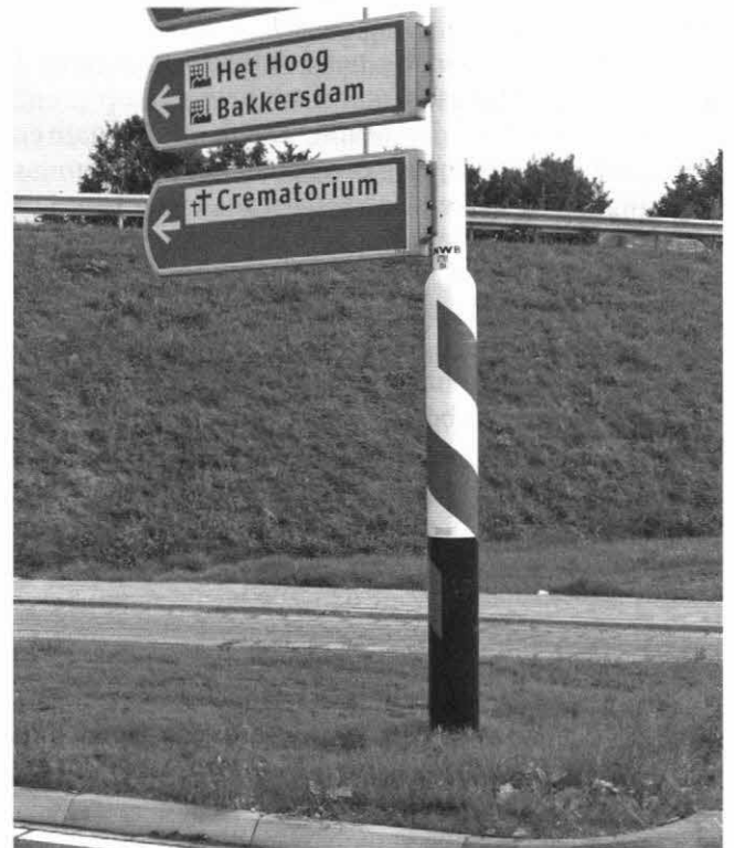
Welke richting wijst ons Gods Woord: begraven of cremeren?

Heel opmerkelijk is natuurlijk dat de Joden en de Christenen vanouds af altijd voor begraven zijn geweest en nooit voor cremeren. Niet minder opmerkelijk is het feit dat toen ons vaderland na de verovering door Karel de Grote gekerstend werd, het cremeren verboden werd. In 785 werd namelijk onder Karel de Grote een wet uitgevaardigd die het cremeren op straffe des doods verbood. Zij die daarvoor gegrepen werden, werden onthoofd. Als dus een land gekerstend werd, verdween het cremeren, zodat we kunnen zeggen dat cremeren niet een Christelijke, maar een puur heidense oorsprong heeft. Cremeren past ook goed in het Griekse filosofische denken ten aanzien van ziel en lichaam. Bij de Grieken zien we een scherpe tegenstelling tussen stof en geest. De Grieken zagen de ziel, de geest van de mens, als het hoogste en het lichaam, het stoffelijke, als iets minderwaardigs. Als iemand stierf dan werd volgens hen zijn ziel uit het lichaam bevrijd gelijk een vogeltje uit een kooitje. Na die bevrijding uit de kerker van het lichaam