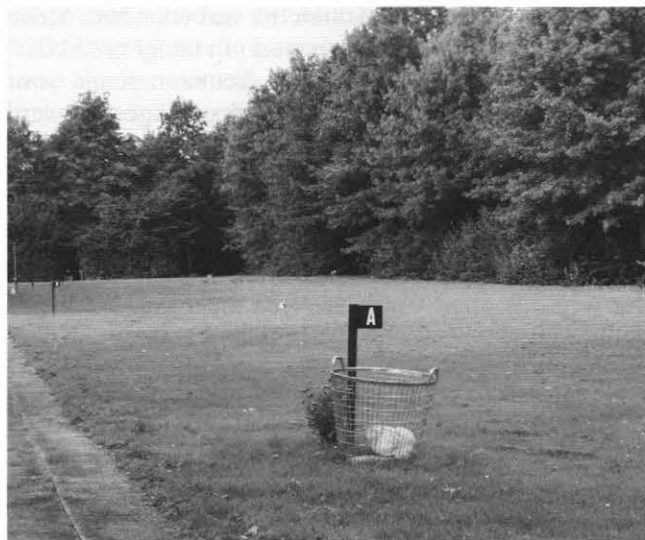
Een strooiveld bij een crematorium. De hindoes willen de as zo snel mogelijk uitstrooien.

Zoals we al schreven, wordt cremeren in ons land inmiddels op zeer grote schaal toegepast. Dit betekent tegelijk ook dat ons land in een verregaande mate ontkerkend, gesecculariseerd, verwereldlijkt is. Velen van ons volk hebben afstand genomen van God en van Zijn