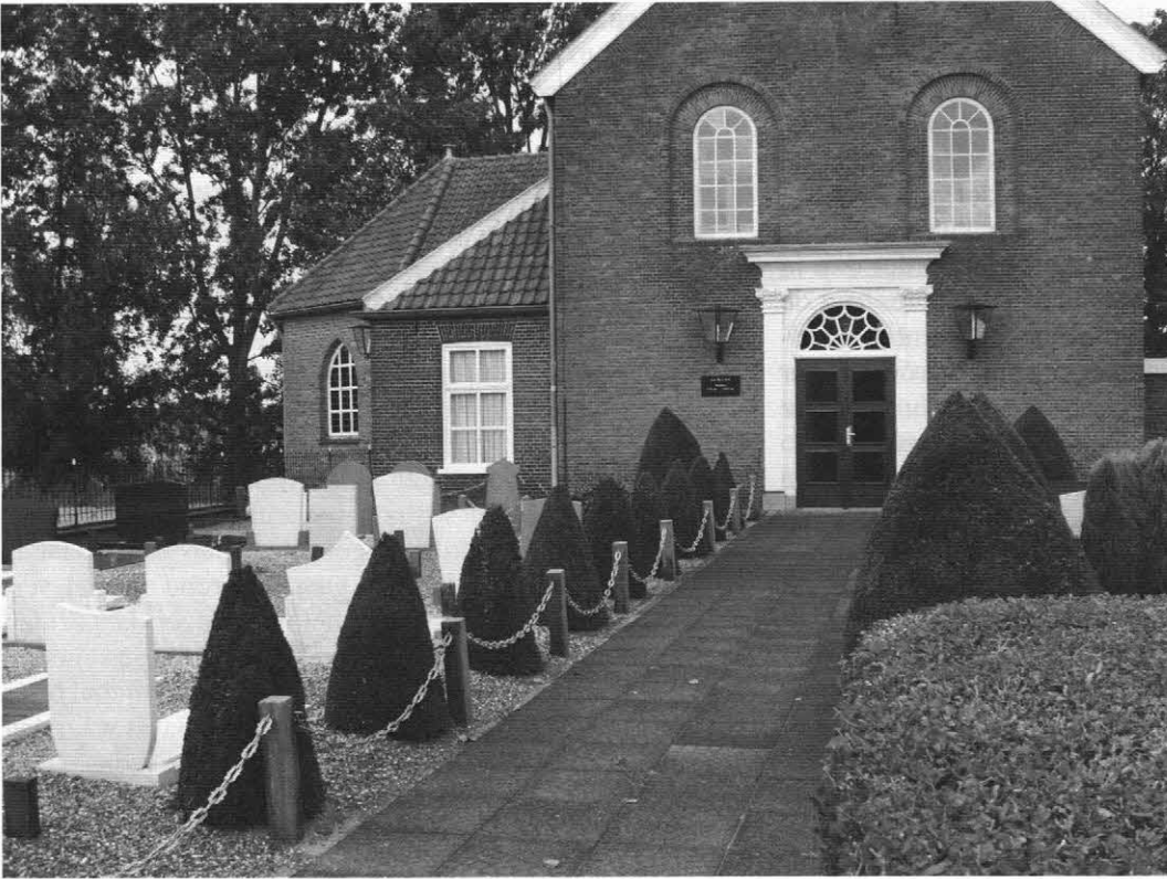
Vroeger stond de kerk in het middelpunt van het dorp en lag de begraafplaats om de kerk heen. Men leefde toen letterlijk en figuurlijk veel dichter bij de dood.

Woord. Ze hebben afgerekend met de Bijbelse normen. Als autonome mens willen ze zelf uitmaken wat goed en kwaad is, ook met betrekking tot de lijkbezorging. Veelal kiest men bewust voor crematie. We kunnen ons dan afvragen: 'Wat hebben mensen die zich laten cremieren, daar nu eigenlijk mee voor?' Wel, in de eerste plaats is daar het verzet tegen de opstandingsgedachte. Niet alleen omdat men zich verzet tegen al wat Christelijk is, maar ten diepste wil men zichzelf ook verbergen, vernietigen, voor Gods aangezicht om zo het oordeel van God te ontgaan. Dit zal echter in de dag der dagen blijken een geheel ijdel pogen te zijn!