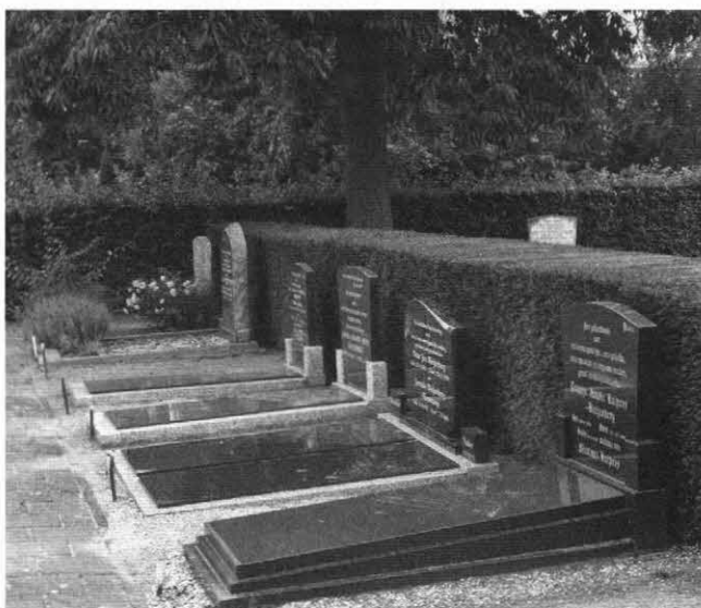
Begraven is niet goedkoop, maar als het geld zo'n belangrijke factor is wat hebben we dan nog voor een ander over?

Als het gaat over de schepping van de mens dan zijn wij enerzijds uit de aarde aards, geschapen uit het stof van deze aarde. Anderzijds heeft de Heere de adem des levens in de neusgaten van de mens geblazen, zodat wij werden tot een levende ziel. Dus aan de ene kant verwant aan deze aarde en aan de andere kant verwant aan de hemel. Door onze eigen schuld, door onze val in Adam, hebben we echter de weg naar de hemel gesloten. Daar is een breuk gekomen tussen God en onze ziel. Met eerbied gezegd, in het paradijs hebben we de Heere buiten de deur van ons leven gezet en is de deur dichtgegaan. Dat is onze schuld en we kunnen die deur vanuit onszelf nooit meer open krijgen. We zijn mensen geworden die niet alleen uit de aarde geschapen zijn, maar nu ook aardsgezind zijn. Wij zitten nu van nature zo vast aan al het aardse, we leven daarvoor. We zoeken de schatten die op deze aarde zijn en niet de dingen die boven zijn. Dit betekent ook dat voor veel mensen het kostenaspect een heel belangrijk punt is bij de keuze tussen begraven en cremieren. Is cremieren goedkoper, dan kiest men eenvoudig daarvoor. Maar als het geld zo'n belangrijke factor is wat hebben we dan nog voor een ander over? Wat hebben nabestaanden dan nog voor de overledene over? De liefde is in onze dagen verkoeld, mede omdat het geld bij velen op de eerste plaats staat. Laat dit bij ons also niet zijn!