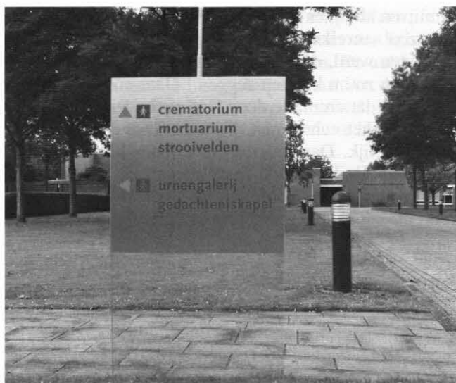
Cremeren heeft niet een Christelijke, maar een puur heidense oorsprong.

zou de mens zich goed kunnen ontplooiën. Zo dachten de Grieken over de verhouding tussen ziel en lichaam. Het lichaam was iets minderwaardigs, het kon daarom na de dood het beste verbrand worden. Dan was het lichaam zo snel mogelijk uit de weg geruimd en was voor de ziel de weg vrij om zich te ontplooiën.