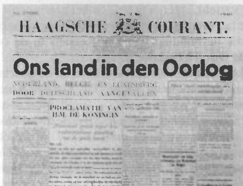
Nederland in de Tweede Wereldoorlog.

Ook na 10 mei 1940 was de overgrote meerderheid der SGP pro-Duits. Men beschouwde Hitler als den man, die Gods oordelen uitvoerde en dies bewonderde men hem. De leiders (ook Kersten) leerden