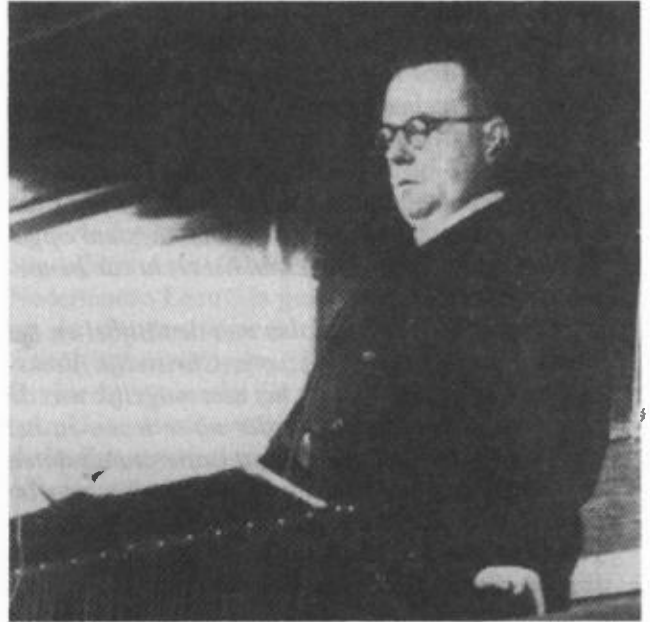
Ds. Kok vervulde hooguit een dominerende achtergrondrol.

evangelisatiegedachte. Deze theorie gaat er immers vanuit dat de school een middel is om niet-christelijke kinderen het evangelie te brengen. Deze theorie werd echter niet onderschreven door de Gereformeerde Gemeenten in het algemeen, waartoe Ds. Kok behoorde en Ds. Kersten in het bijzonder. Of Ds. Kok met betrekking tot het door Ds. Kersten gegeven advies met hem contact gehad heeft is niet meer dan waarschijnlijk vast te stellen. Ds. Kok speelde op zijn hoogst een dominerende achtergrondrol.