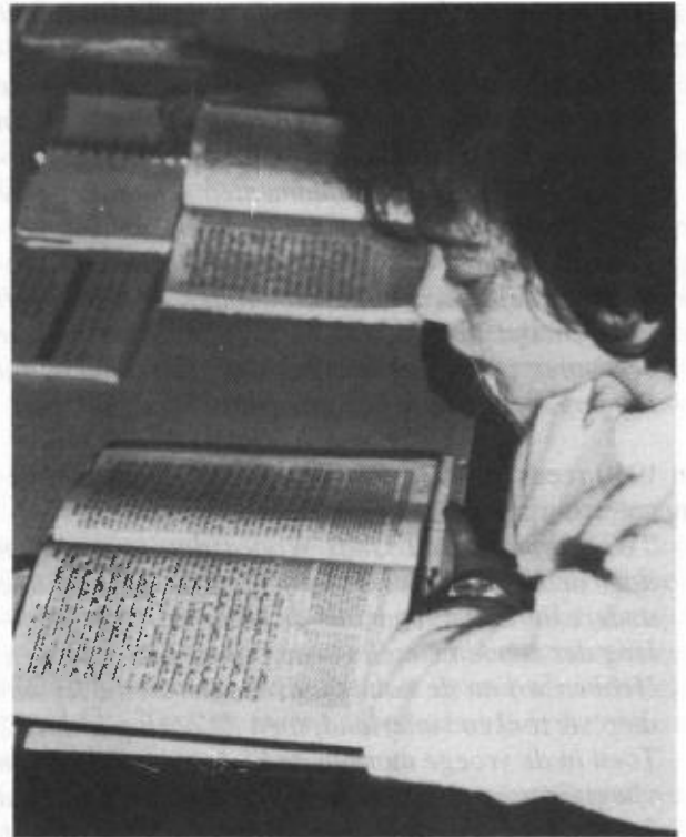
Bemind om der vaderen wil.