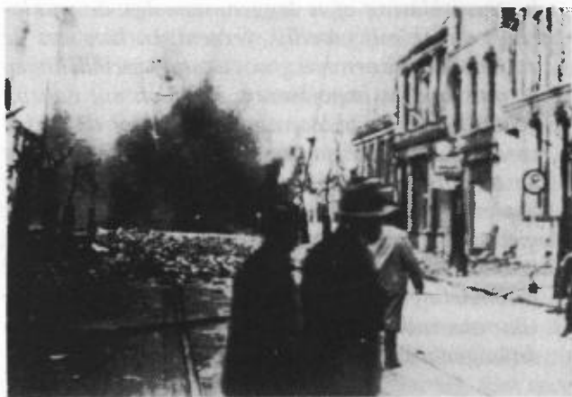
Een ontzettende verschrikking.

"Wij vermanen uit Gods Woord dat de oorlogen door de Heere verwekt worden en dat Hij ook alle andere oordelen zendt, als de rechtvaardige bezoeking der zonden en ten goede Zijner uitverkorenen. Hebben wij nu de hand Gods mogen zien over ons diep verzonken vaderland, toen de oorlog uitbrak? Toen in de vroege morgen de lucht zwart werd van vliegtuigen en toen vreemde krijgsmachten ons land bezetten? Toen de bommen onze steden deden schudden; onze huizen in puin deden nederzinken en honderden en nog een honderden het leven lieten? Welk een ontzettende verschrikking kwam over ons. Nooit zullen wij die dagen kunnen vergeten. Maar.... hebben wij leren bukken voor God? Gij en ik? Hebben wij Gods rechtvaardig oordeel mogen erkennen en Zijn Majesteit aanbidden? Velen zien niet verder dan de macht, die ons overweldigde" 28) .