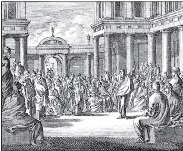
Paulus prekend op de Areópagus te Athene. Zowel het oude Griekeland als het Romeinse Rijk was bekend met het verschijnsel van een intense homoseksuele gerichtheid. Zeer waarschijnlijk heeft dan ook Paulus hiervan geweten.

We hebben hierboven al gezien dat Paulus de homoseksuele daden als zodanig veroordeelt, onafhanke-