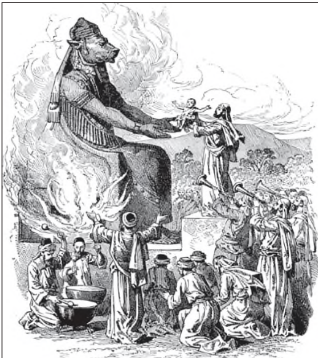
In Leviticus 18 vers 21 wordt het brengen van kinderooffers aan Molech verboden. Niemand zal willen beweren dat dit verbod nu niet meer geldt. De strekking van ook dit gebod is dus ethisch van aard.

In Leviticus 18:22 lezen we: Bij een manspersoon zult gij niet liggen met vrouwelijke bijligging; dat is een gruwel. In Leviticus 20:13 wordt hetzelfde gezegd: Wanneer ook een man bij een manspersoon zal gelegen hebben met vrouwelijke bijligging, zij beiden hebben een gruwel gedaan; (...). We vinden hier een duidelijke en scherpe veroordeling van de homoseksuele praxis. Maar men brengt ertegen in dat het hier specifiek alleen zou gaan om een veroordeling van de homoseksuele ‘tempelprostitutie’ die bij de Kanaänieten en andere heidense volken voorkwam, waarbij schandjongens misbruikt werden door mannen.