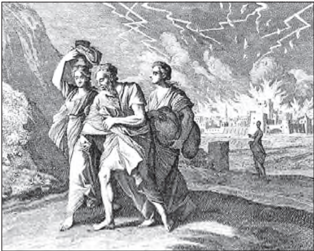
De omkering van Sódóm en Gomórra. Het hoereren en na- gaan van ander vlees - dat in die steden algemeen was gewor- den - hadden de maat der zonde volgemaakt en het strenge oordeel Gods over die steden ingeroepen.

dat wij als Nederlanders hier nog in vrijheid mogen wonen. Feitelijk is het geen vraag meer of er oordelen Gods over ons komen, maar wanneer die komen. De oordelen Gods kunnen niet uitblijven. 22