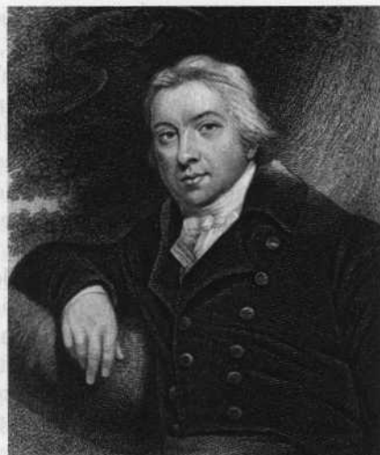
Edward Jenner (1749-1823). Vanwege zijn vaccinevinding werd hij alom geprezen, ja, zelfs als een god vereerd.

Wordt eeuwig Jenners naam, als Vadernaam, gevierd." 3)