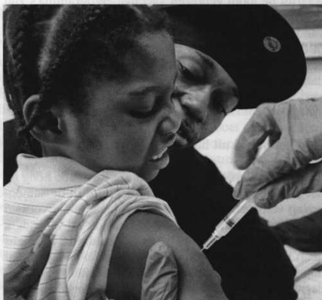
Met zich te laten vaccineren tracht men God in Zijn wijs beleid voor te zijn, ja, het beleid van gezondheid en krankheid Hem uit handen te nemen. Vaccinatie is daarom een ongeoorloofd middel.