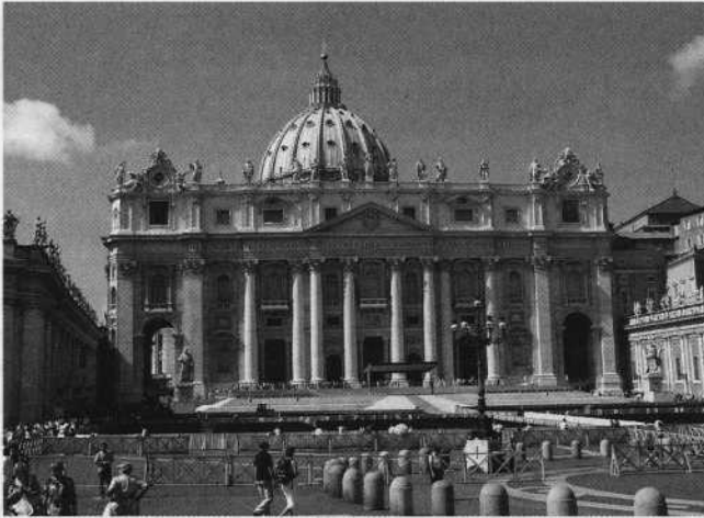
De Sint-Pietersbasiliek te Rome. De actief door de pausen bevorderde Mariaverering druist lijnrecht in tegen Gods Woord, waarin ons bevolen wordt om alleen God te aanbidden.

lig Avondmaal leert dat alle afgodendienaars, allen die verstorven heiligen, engelen of andere schepselen aanroepen, allen die de beelden eer aandoen, geen deel in het Rijk van Christus hebben. (...)